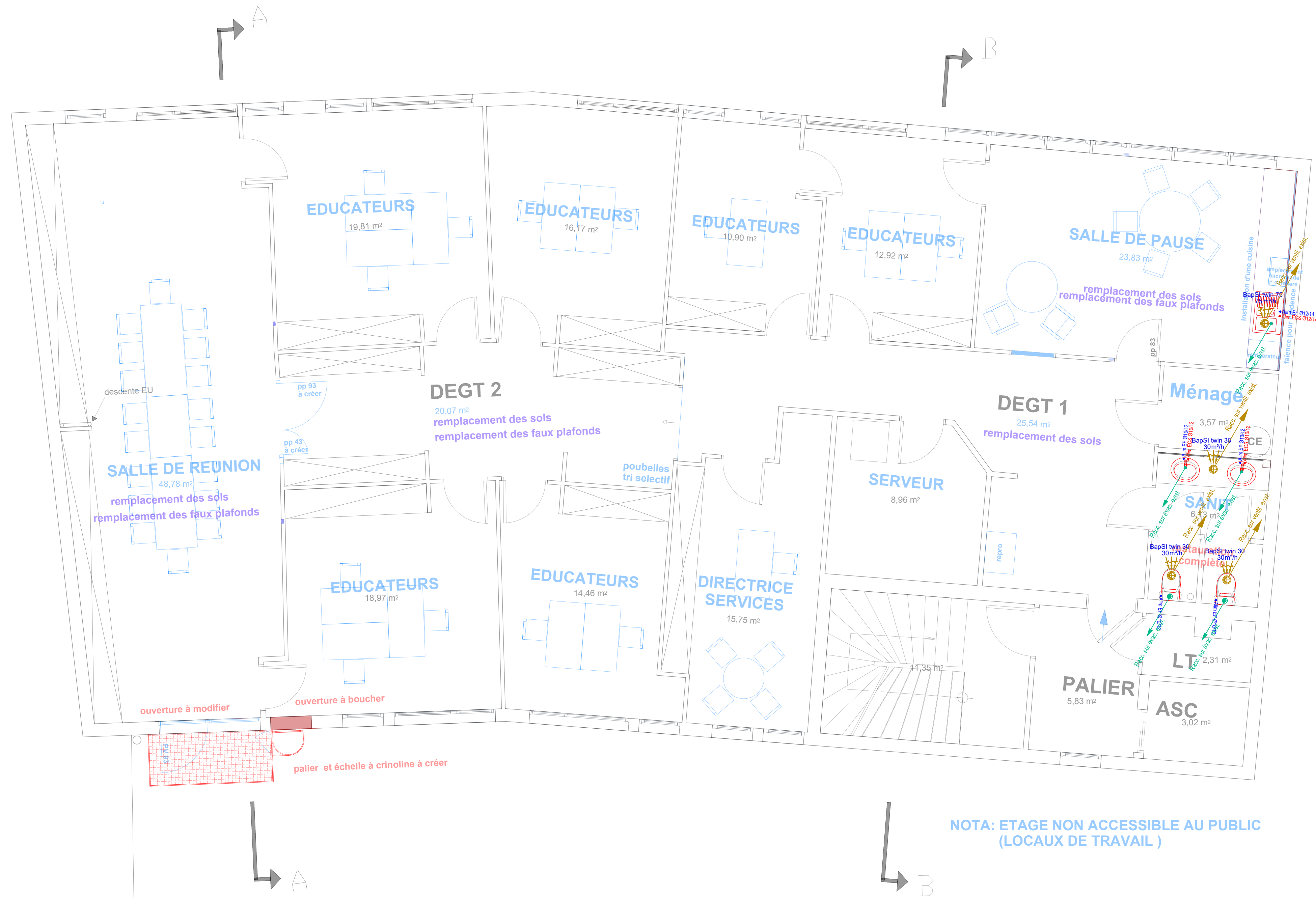
ETAGE 1 [1/50]